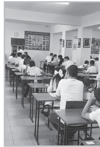
Կարդացե՛ք էջ 6

Հ այաստանի բոլոր դպրոցների 9-րդ դասարանի սովորողները հունիսի 24-ին «Գրականություն» եւ «Հայաստանի պատմություն» առարկաների ավարտական քննությունը հանձնեցին էստեի ձեւաչափով՝ երկու առարկաների բովանդակությունն ինտեգրող գրավոր աշխատանքի միջոցով, որը նորամուծություն է եւ շատ գնահատվեց ժամանակին: