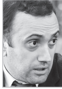
Կարդացե՛ք էջ 7

Իսկ ի՞նչ է այնքան ուժեղ, որ կարող է երաշխավորել իր դաշնակիցների անվտանգությունը, զինվյալ ԱՄՆ-ն, որի մերձավորարեւելյան դաշնակիցներ Կատարը, Բահրեյնը, Միացյալ Էմիրությունները, Սաուդյան Արաբիան ենթարկվում էին Իրանի հրթիռակոծմանը միայն այն պատճառով, որ իրենց տարածքում ամերիկյան ռազմաբազաներ էին կառուցել: