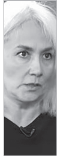
Հարցազրույց քաղաքագետ Նվարդ Մանասյանի հետ

- Այս 2 կողմում ժողոված անբանակցելի չարածիներին այս պահին հավասարակշռության բերած ժողովուրդը շատ ժամանակ չունի: Համակարգի քայքայումը մտել է որոշիչ փուլ: Երբ որեւէ կառուցվածքում դիմադրության կետերի քանակը փոքրանում է, մեծանում է փլուզման վտանգը: Փոխաբերական իմաստով, վթարային շենքում արթնանալու ու չգործելը հավաքական անպատասխանատվություն է: Բոլոր նրանք, ովքեր սա տեսնում են, պետք է գործեն, ու բացարձակ կարելու չէ՝ քաղաքական գործիչ են, թե տնային տնտեսուհի: Եթե այս արձանագրումն արել ենք,