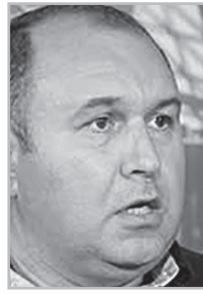
Կարդացե՛ք էջ 7

Դրա շարունակությունն այն է, ինչն այսօր տեղի է ունենում Նախիջեւանում: Դա նաեւ մեր չարձագանքելու արդյունքն է, ադրբեջանցիներն այնքան են լկտիացել, արդեն ֆորումներ են անցկացնում, այսպես կոչված, Արեւմտյան Ադրբեջան վերադառնալու համար: Միևնույն այդ հարցը կփակվեր, երբ դեռ սահմանազատման ժամանակ պահանջելիք: