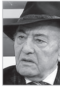
Կարդացե՛ք էջ 6

Ա նցավ չարչարանաց 4 շաբաթը, արդեն ակնհայտ է, որ դու գալիս ես՝ թո՛ղ ժողովրդի կանչով: Ուստի մտածեցի մի քանի մտքերով կիսվել թե՛գ հետ... Եվ ասելիքս փորձեցի տեղավորել ինը խորհուրդների մեջ, քանզի 9 թիվը ոչ միայն հին աշխարհում, այլ նաեւ հայոց հին տոմարով համարվում է սրբազան: Խնդրում եմ ուշադիր հետեւես խոսքիս: