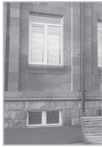
Կարողացե՛ք էջ 5

«Արամայիս եւ Ռոզա Աստույաններ» ընտրողներ կամ ցուցակում: «Բանակցելուց» հետո բացեց ցուցակը՝ ցույց տվեց: Այր, անունները կային: Արամայիս Աստույանն իմ հայրն է, որը մահացել է 26 տարի առաջ: Ռոզա Աստույանն իմ մայրն է, որը մահացել է 7 տարի առաջ: Երկուսն էլ շարունակում էին «ապրել» ընտրացուցակում: