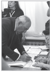
Կարողացե՛ք էջ 4

Ամեն ինչ ոչնչացրեց, վերացրեց, քանդեց. պատերազմ, մահ, հայրենազրկում: Գիտություն, մշակույթ, ստեղծագործ աշխատանք՝ բոլորը փախան երկրից, ուժայինների դարձրեց ձեռնասուն կուռկուռի ձագ, դռները բոլոր կողմերից բացեց ասպատակությունների առաջ: Մենք, սակայն, Նիկոլ ընտրեցինք: Դեբիլ էինք, թե՛ հայի բախտ ունեինք: